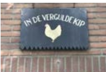
'in de vergulde kip', het bord boven de deur van het CJV gebouw.

Op woensdag 17 mei organiseert het bestuur de voorjaarsvergadering voor alle leden van de buurtvereniging. Deze keer maken we gebruik van de ruimte van het CJV. Vanaf 19.45 uur is de zaal open, de vergadering start om 20.00 uur.