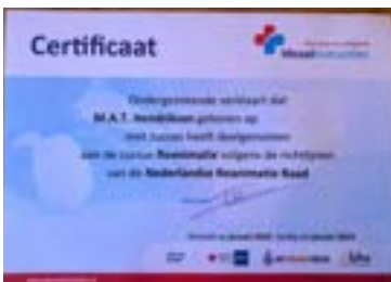
Het certificaat van de cursus

Bij de Huppe is sinds een jaar een AED aanwezig. Daarmee zijn vooral de bezoekers en bewoners geholpen die in de nabijheid van De Huppe wonen of verblijven. Want de vuistregel is dat bij een hartstilstand binnen 6 minuten een AED moet zijn aangesloten.