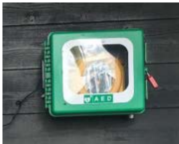
De AED bij De Huppe

Door de reanimatiecursus hebben inmiddels diverse buurtbewoners geleerd hoe ze bij een hartstilstand handelend kunnen optreden. Naast hartmassage en beademingen, kan ook de AED een belangrijke rol hebben. Maar dan moet dit apparaat wel in de directe nabijheid van het slachtoffer beschikbaar zijn.