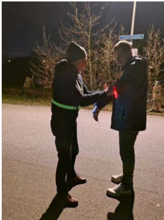
Een wandelaar ontvangt de LED-armband.