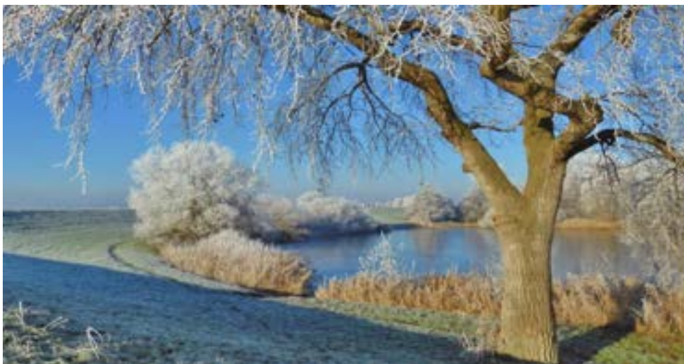
Foto van een winters tafereel in het Oldenelerpark, afkomstig uit Nieuwsbrief Belangengroep Oldenelerpark