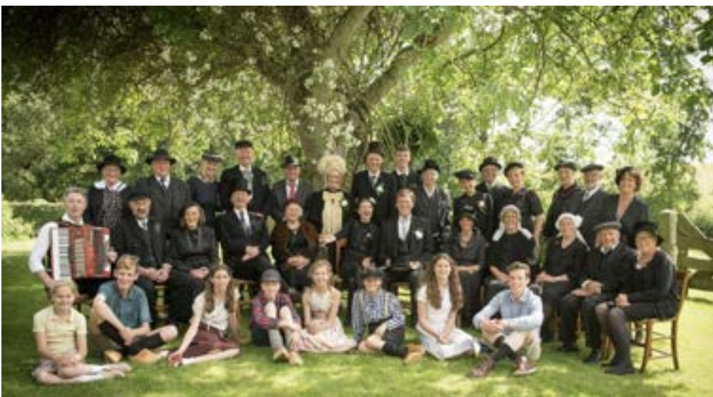
De crew van de film.

De promotie van deze film en het beschikbaar stellen bij filmfestivals wordt verzorgd door Project IJselfilm.